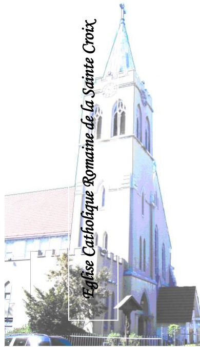
Eglise Catholique Romaine de la Sainte Croix